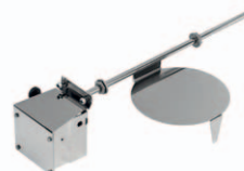
Skyddslock över kvarn-inlopp i disklåda/diskbana